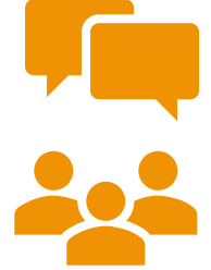
ERFA-MØDE 2 PÅ EGEN ELLER NABOSKOLE