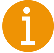
OPSTARTSMØDE: TRIO OG SKEMAER