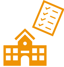
HJEMMEARBEJDE I TRIO