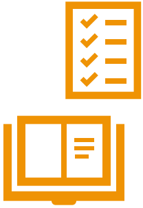
FORBEREDELSE I TRIO