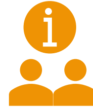
SIDEMANDS- OPLÆRING: OVERFØRSEL TIL LØN