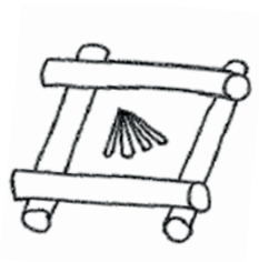
Tegning 1: Bunden af et pagodebål med optænding.