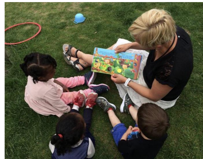
Udendørs dialogisk læsning: En anden måde at bruge udezonerne på.