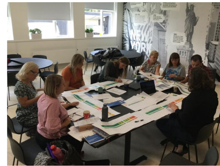
Et udvalg arbejder med at analysere data fra CLASS forløbet.