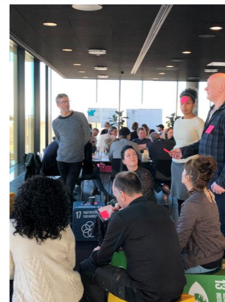
Workshop 2 – PÅ TVÆRS Sammen reflekterer vi over dogmerne Vanebrud, Det uperfekte, Væredygtighed og Blackout/klima. Vaner brydes med processer og anderledes måder at være tilstede på.

På workshop 2 fortsatte vi SLF rejsen. Her stillede vi endnu skarpere på det at reflektere over vores værdier ift. til vores praksis. Workshoppen var struktureret som et forberedende arbejde til det fælles projekt PÅ TVÆRS. Forud havde en "tænk tank" udarbejdet en drejebog for På Tværs med succeskriterier, emner, dogmer,