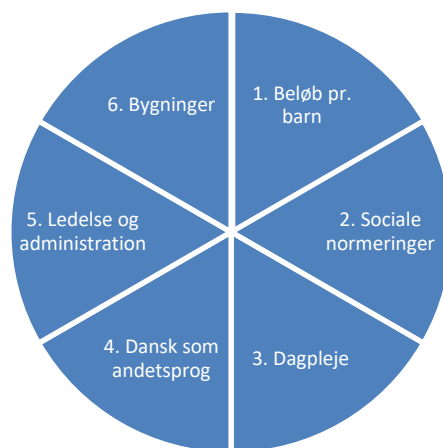
Figur 1: Delmodeller i budgettildelingsmodellen

Et af de bærende principper i økonomistyringen i Børn og Unge er decentralisering. Det betyder, at det er op til det enkelte dagtilbud at disponere og budgetlægge de samlede midler, de ud fra budgettildelingsmodellens tildelingskriterier, har fået. Den økonomiske decentralisering går hånd i hånd med den faglige decentralisering, så det økonomiske ansvar er tæt knyttet til den faglige beslutningskompetence.